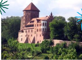
Burg Rieneck Schlossberg 1, 97794 Rieneck

Anreise für Tramper*Innen: Die A3 an der Anschlussstelle 54 (Hanau) verlassen und der Beschilderung zur A66 Richtung Fulda folgen. Auf der A66 noch an Gelnhausen vorbei und dann die Abfahrt 45 (Bad Orb) nehmen und nach Bad Orb weiterfahren. (Achtung in Bad Orb: 40 km/h und ein Blitzer am Ortsausgang auf der Hinfahrt und auf der Heimfahrt!) Durch den Ort immer geradeaus der Hauptstraße folgend weiter bis Jossgrund. Dort nach rechts Richtung Gemünden über die Orte Aura, Fellen, Burgsinn nach Rieneck.